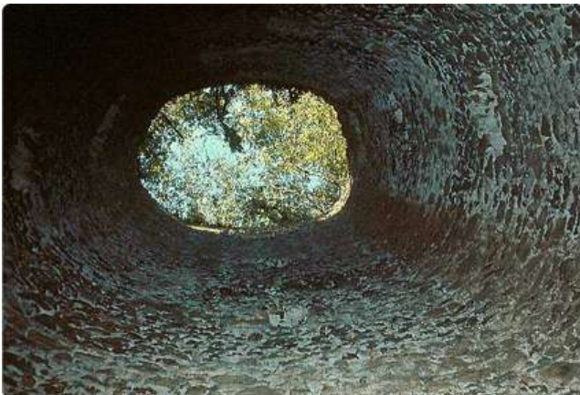
L'Envòl de la tartana – Roland Pécout